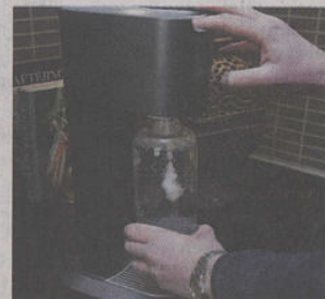
Hemgjorda bubblor är både miljövänligt och ekonomiskt. FOTO: BERTIL ENEVÅG ERICSON/SCANPIX

Källa: Svenskt Vatten, Sveriges Bryggerier